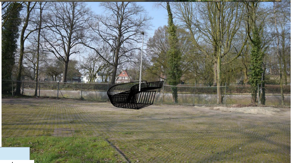
Fietsbrug over de Jeker gezien van uit zuid-west punt